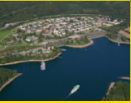
Blick auf Sondern

Veranstalter: Verkehrsverein Olpe/Biggesee e.V.